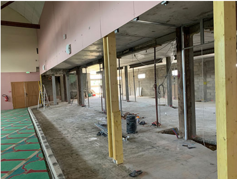
Vue 2 sur la mezzanine