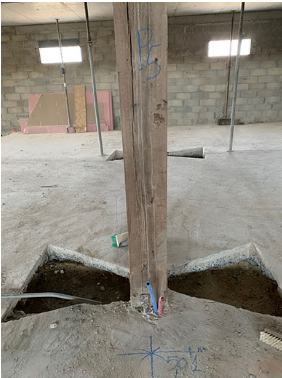
Exemple , Poteau p5 (file périphérique)