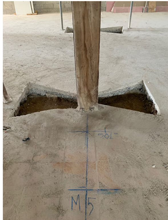
Exemple , Poteau M5 (file Mezzanine)