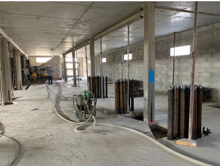
File centrale (C)