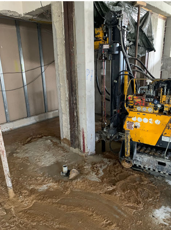
P7, les premiers micropieux / Côté escalier