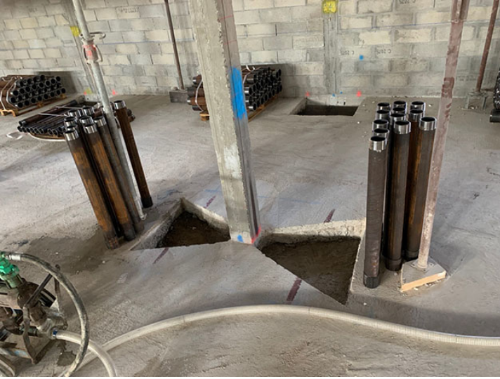
File centrale (C)